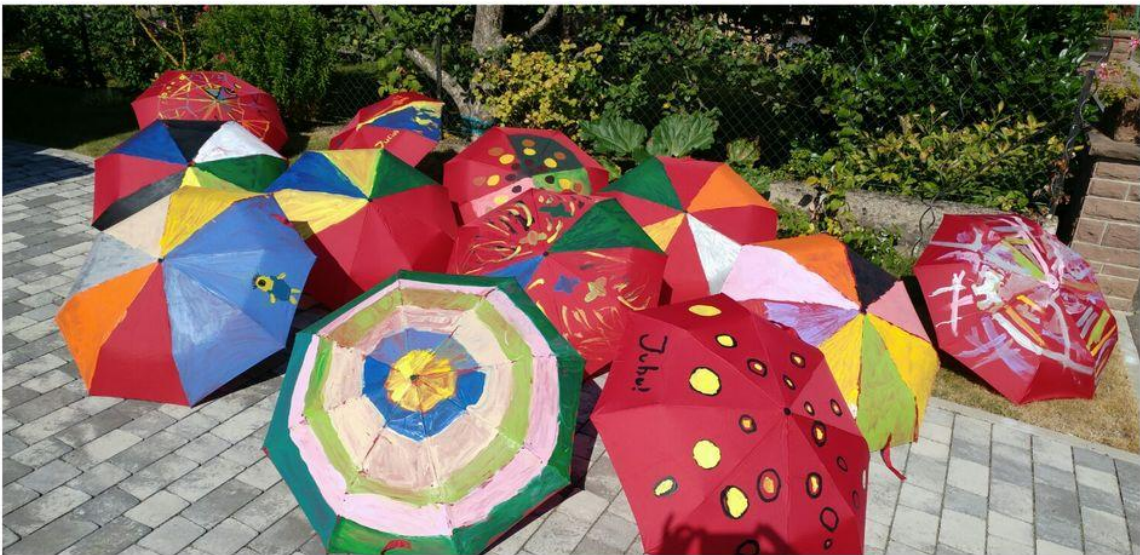
Jeder Schirm ein kleines Kunstwerk